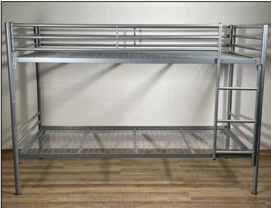
Abbildung komplett mit Set Absturzsicherungen und Leiter